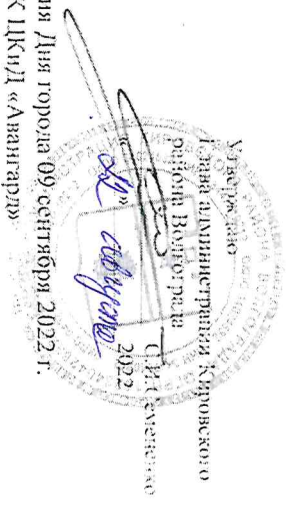
Схема размещения нестационарных торговых объектов при проведении празднования Дня города 09 сентября 2022 г. с 14.00 до 21.00 по адресу: Волгоград, ул. 64-й Армии у площади МУК ЦКид «Авангард»